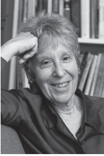
Joan Wallace Scott Proferosa emérita, Institute for Advanced Studies.